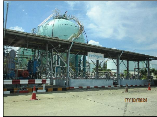
คลังก๊าซปิโตรเลียมเหลว