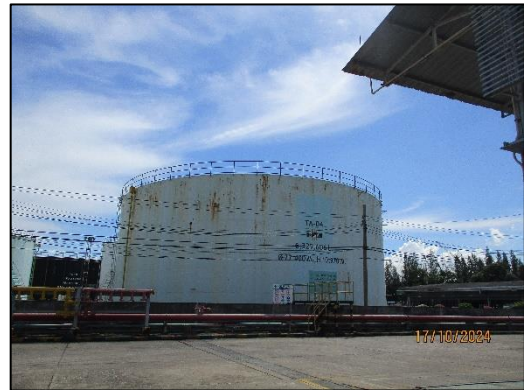
คลังน้ำมัน