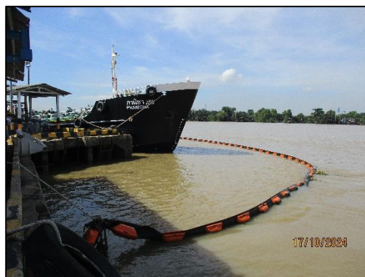
ท่าเทียบเรือ Slipway 2