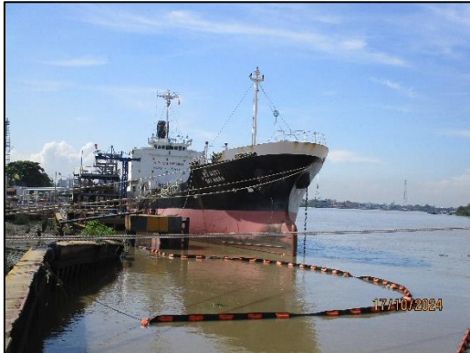
ท่าเทียบเรือ 18G