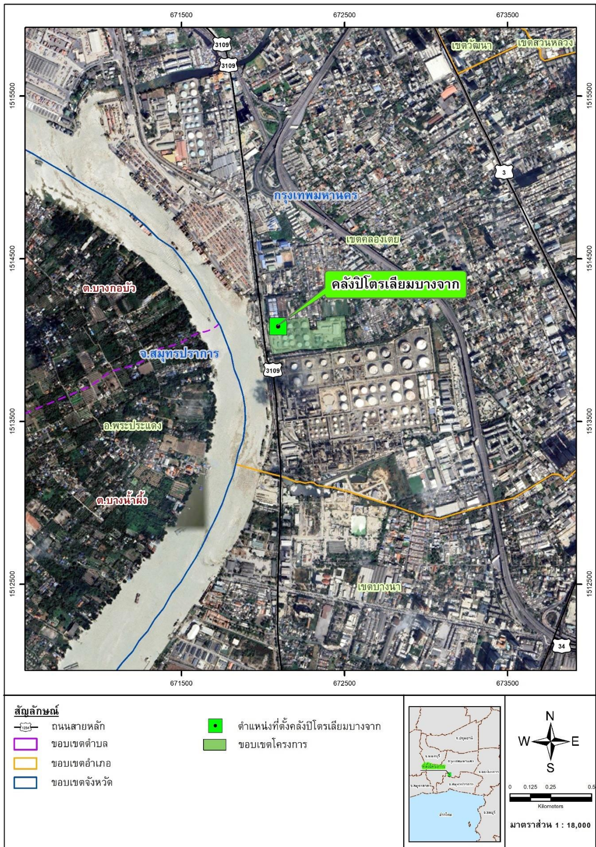
รูปที่ 1.4.1-1 ที่ตั้งและขนาดโครงการ