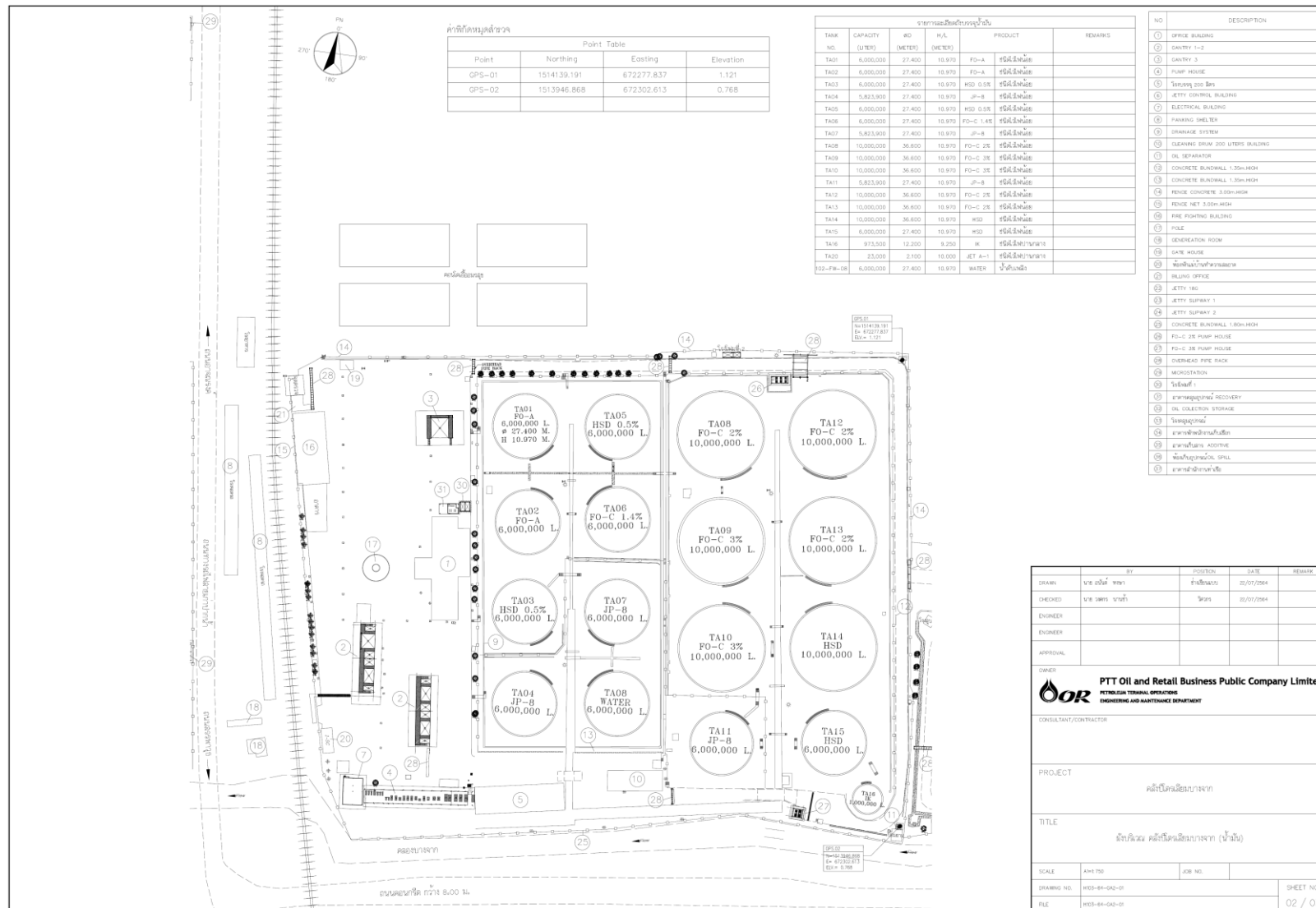
รูปที่ 1.4.2-2 รายละเอียดส่วนประกอบคลังน้ำมัน คลังปิโตรเลียมบางจาก