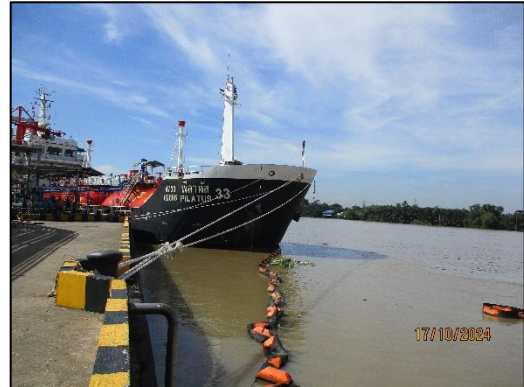
ท่าเทียบเรือ Slipway 1